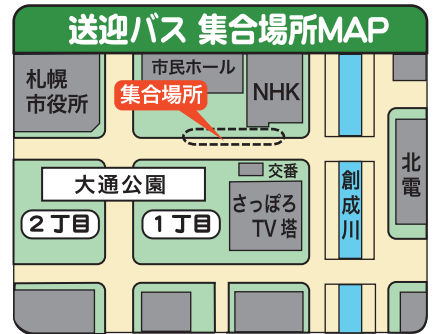
※大通公園1丁目北側