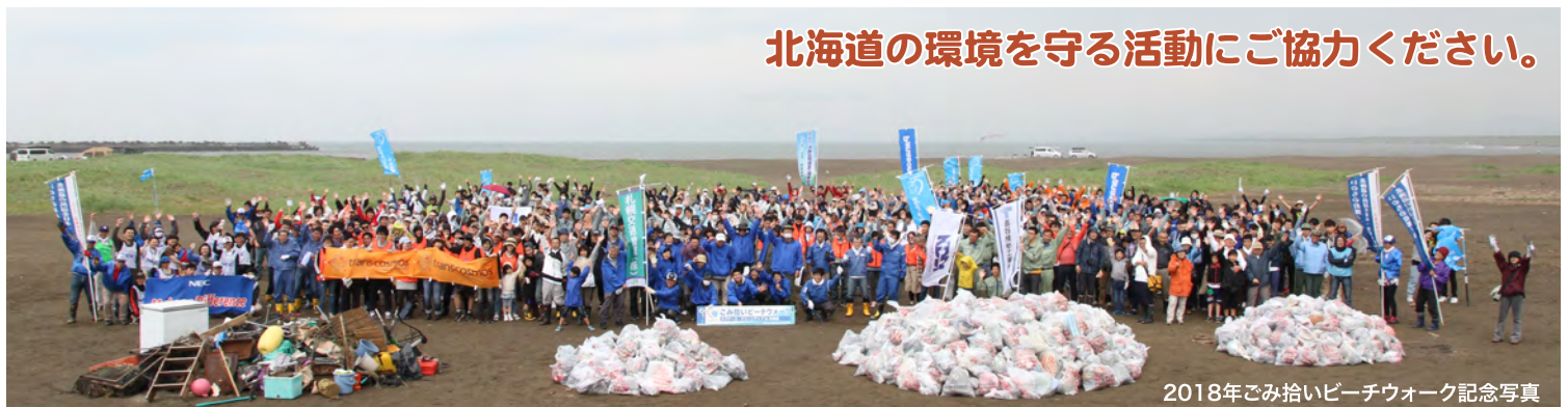
2018年ごみ拾いビーチウォーク記念写真