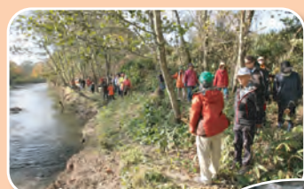
ウヨロ川フットパス ウォーキング