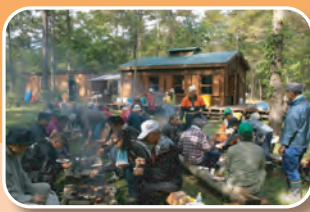
トラストの森でバーベキュー