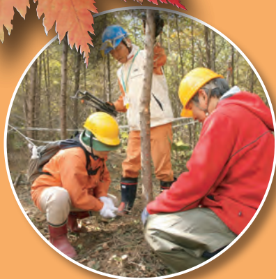
カラマツの除間伐のようす