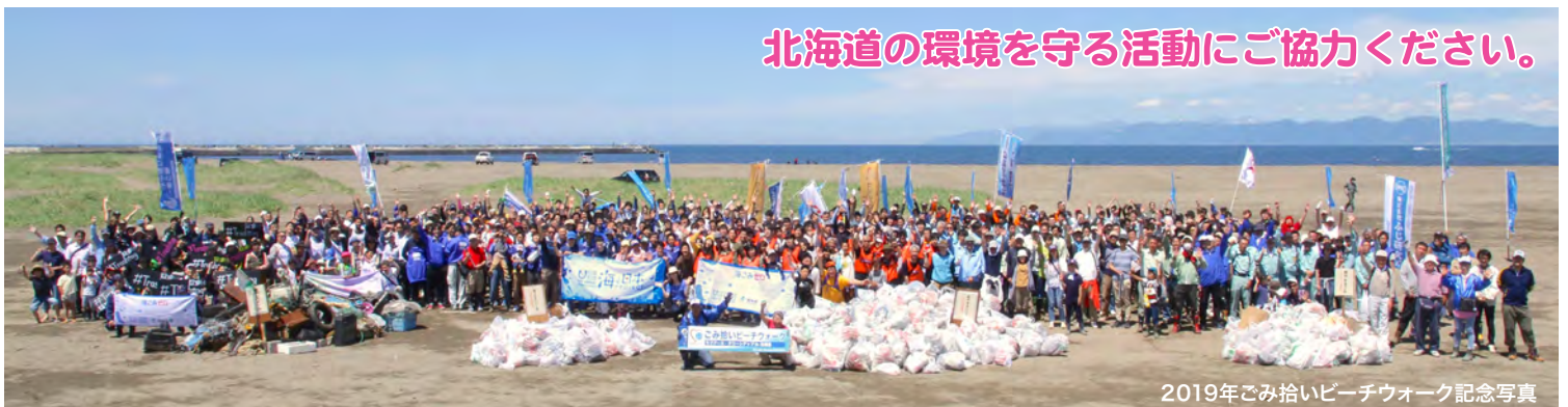
2019年ごみ拾いビーチウォーク記念写真

お問い合わせ (主催) / NPO 法人 北海道市民環境ネットワーク 「きたネット」